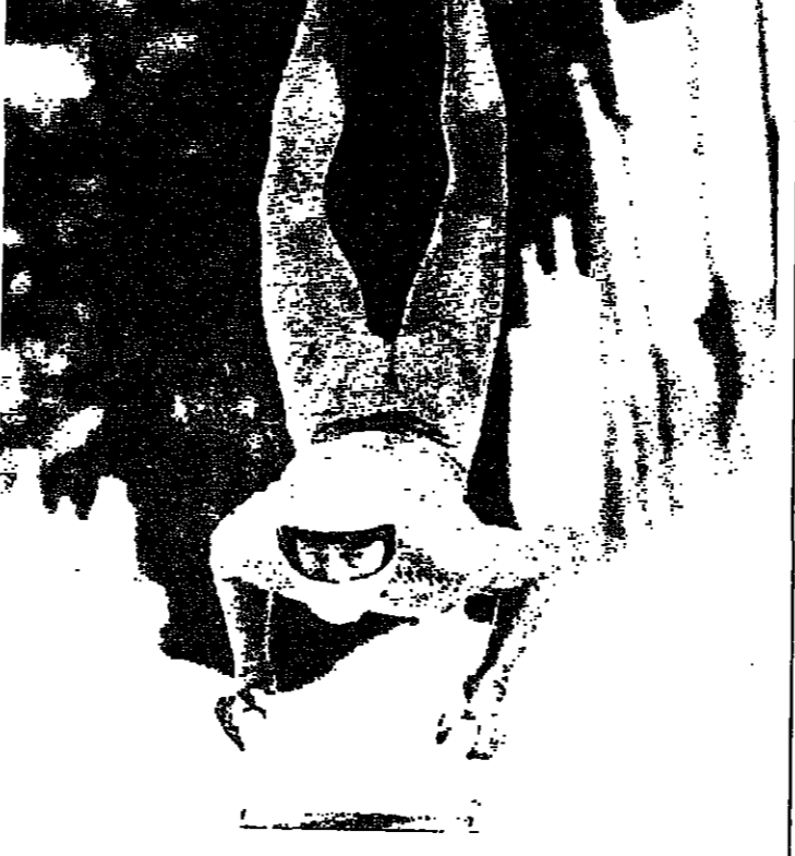
لقطة طريقة التقطت في سان موريتز (سويسرا) ويبدو فيها السويدي الان ويكي خلال مسابقات الزحفات الثلجية الغربية (اللاج) لكن على مضمار الزحفات السريعة (بوب نغ) ويقتسم هذا النوع بالخطورة

سجلت اكثر من مفاجاة في دور الـ ٣٢ من مسابقة كاس تونس لكرة القدم ابرزها خسارة النادي البنزرتي حامل كاس الكؤوس الافريقية لعام ١٩٨٨ امام الاتحاد المنستيري ٢/١.